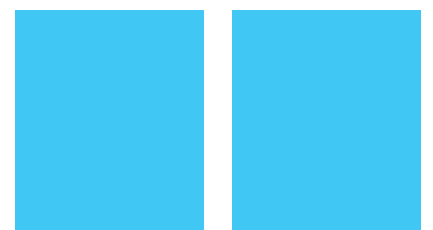
Coroplast 4133 Coroplast 5170